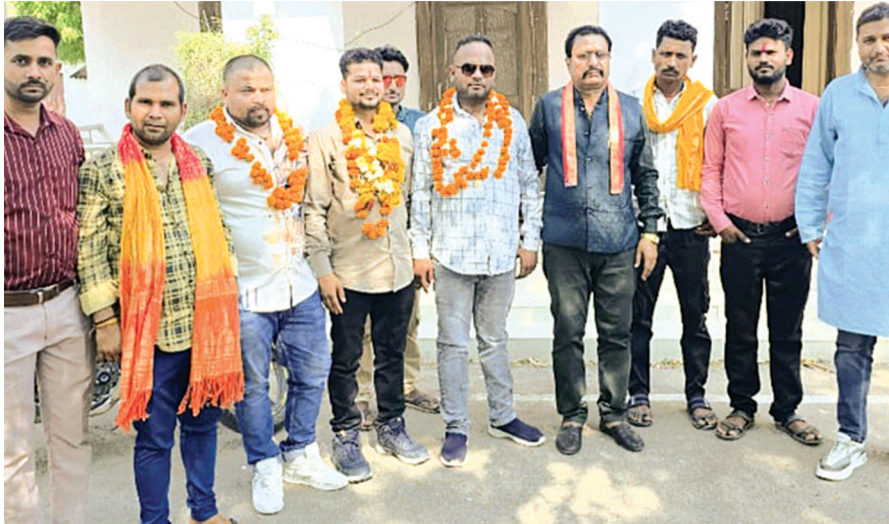
हरिभूमि न्यूज ▶ पलेरा