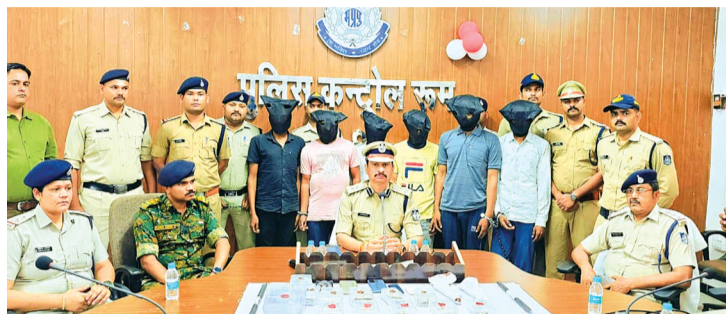
दो गांव में बड़ी वारदात अंजाम देकर टी पुलिस को चुनौती